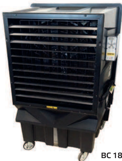
BC 180 (30")