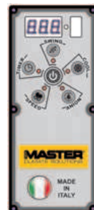
Pannello di controllo